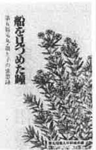
船を見つめた瞳 各界の反響

船を見つめた瞳が発行されてから三カ月、その主な反響をみると、新聞では、朝日、毎日、中国、赤旗の日報紙のほか平和新聞、少年少女新聞、新婦人新聞、原水協通信、東建新報、原力ニュースなどに紹介記事がのり、さらに文化評論、子ども達の雑誌にも紹介されました。